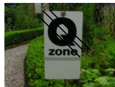
EINDE Q-ZONE (2.12)